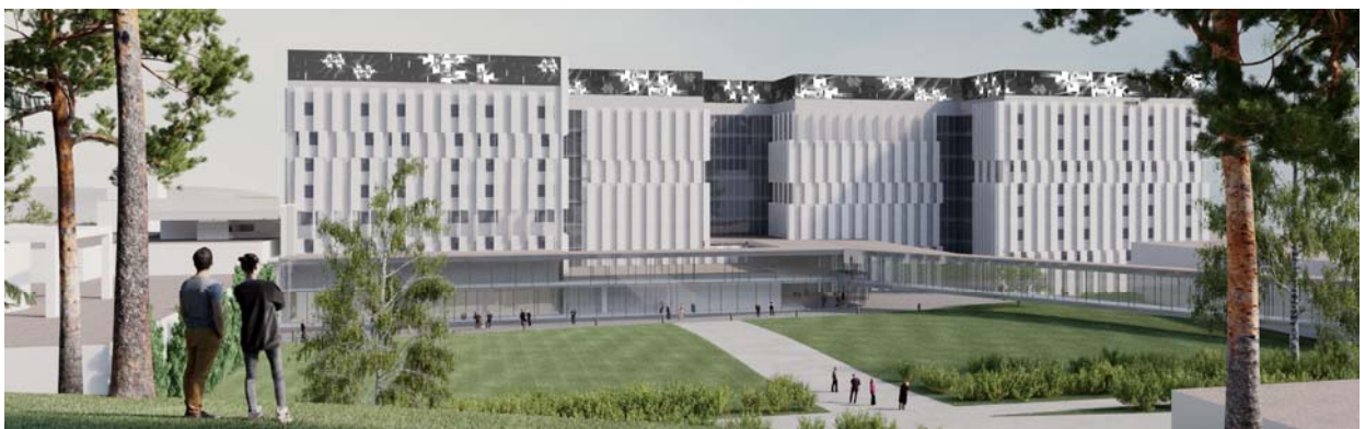
Havainnekuva valmiista KYS Uusi Sydän 2025 projektista

Lisätietoja: Titta Haatainen, titta.haatainen@kuh.fi